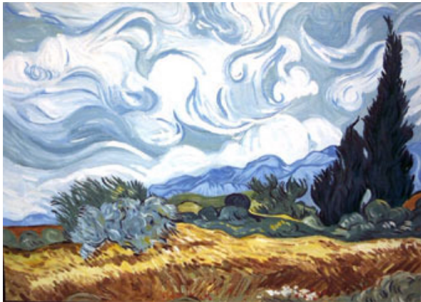
Campo de trigo con ciprés, de Van Gogh